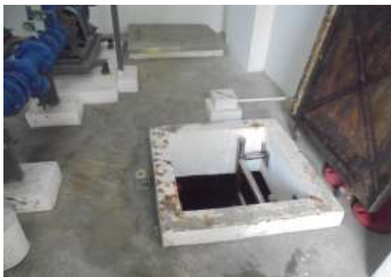
รูปที่ 13 จุดเก็บน้ำใต้ดิน