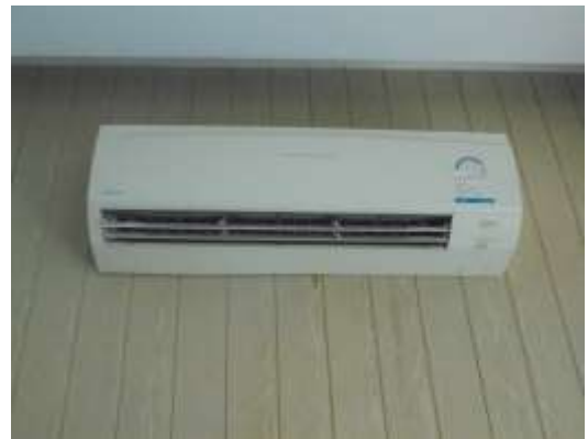
รูปที่ 22 โครงการเลือกใช้อุปกรณ์ไฟฟ้ารุ่นประหยัดไฟเบอร์ 5