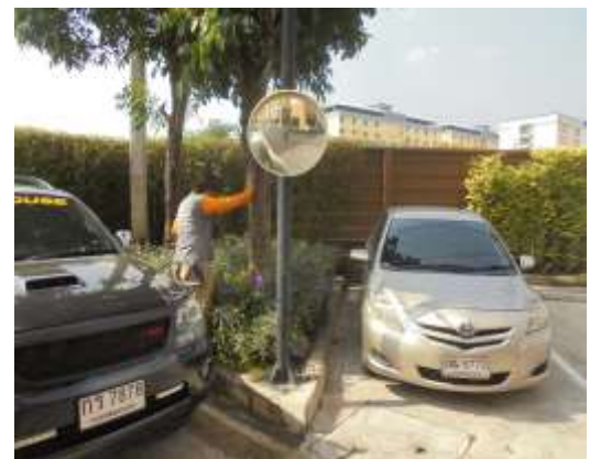
รูปที่ 36 กระจกเงา