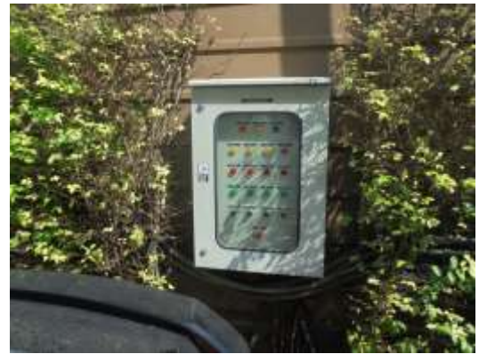
รูปที่ 8 ตู้ควบคุมระบบบำบัดน้ำเสีย