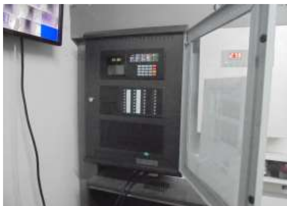
รูปที่ 23 ตู้ควบคุมระบบเตือนภัย