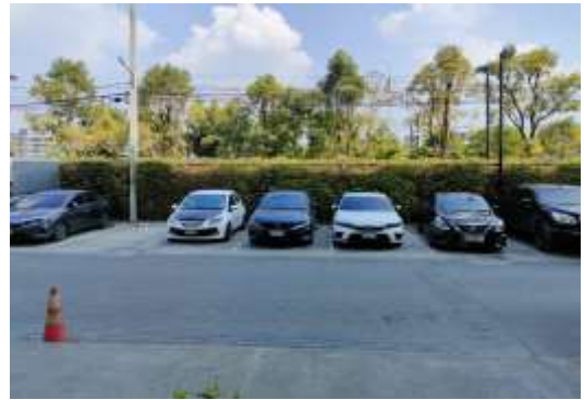
รูปที่ 2 พื้นที่จอดรถ