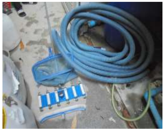
รูปที่ 38 อุปกรณ์ทำความสะอาดสระว่ายน้ำ