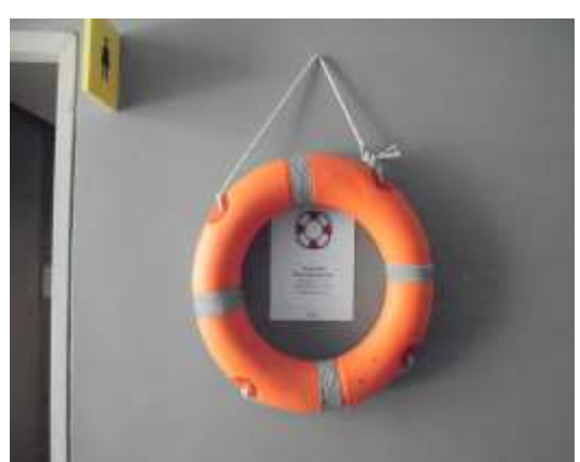
รูปที่ 42 อุปกรณ์ด้านความปลอดภัยสระว่ายน้ำ