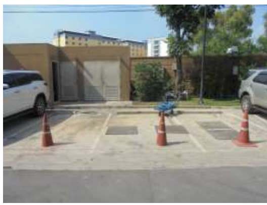
รูปที่ 18 บริเวณจุดจอดรถจัดเก็บมูลฝอย