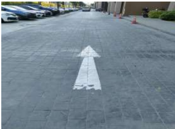
รูปที่ 33 สัญลักษณ์จราจรบนพื้นถนน