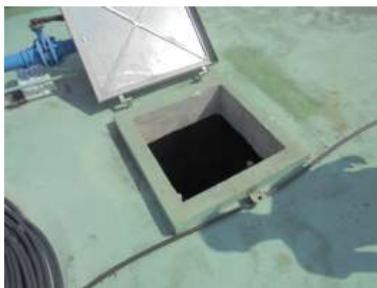
รูปที่ 14 จุดเก็บน้ำใต้ดินชั้นบนหลังคา