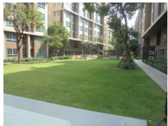
รูปที่ 6 บริเวณพื้นที่สีเขียวภายในโครงการ