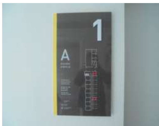
รูปที่ 28 แผนผังอาคารแสดงตำแหน่งทางหนีไฟ