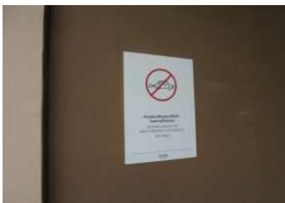
รูปที่ 5 ป้ายห้ามเครื่องยนต์ทิ้งไว้