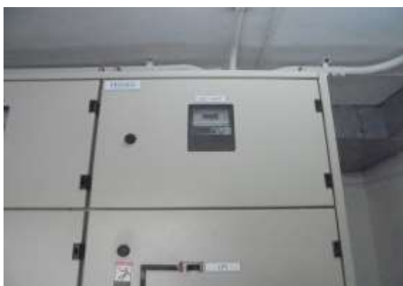
รูปที่ 11 ตู้ควบคุมระบบมิเตอร์ไฟฟ้า