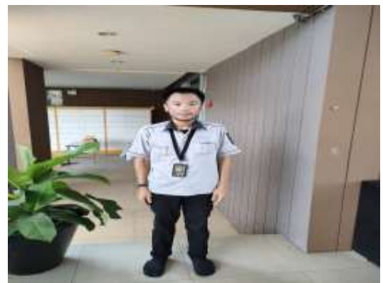
รูปที่ 10 เจ้าหน้าที่ควบคุมระบบบำบัดน้ำเสีย