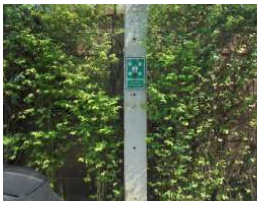
รูปที่ 26 บริเวณจุดรวมพลภายในพื้นที่โครงการ