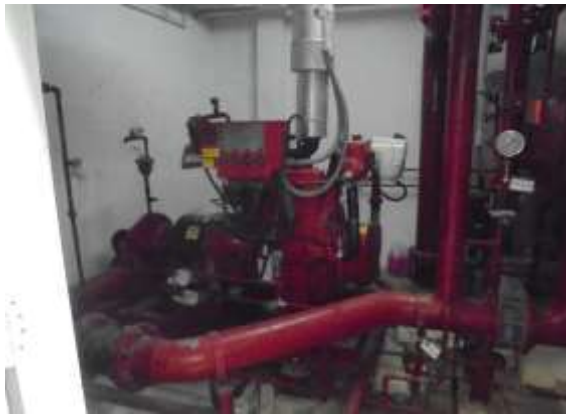
รูปที่ 31 ท่อเย็นน้ำดับเพลิงภายในอาคาร