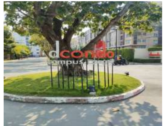
รูปที่ 34 ป้ายชื่อโครงการ