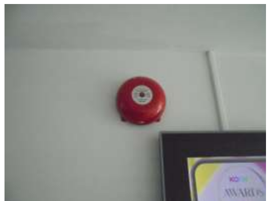
รูปที่ 24 อุปกรณ์ตรวจจับควัน