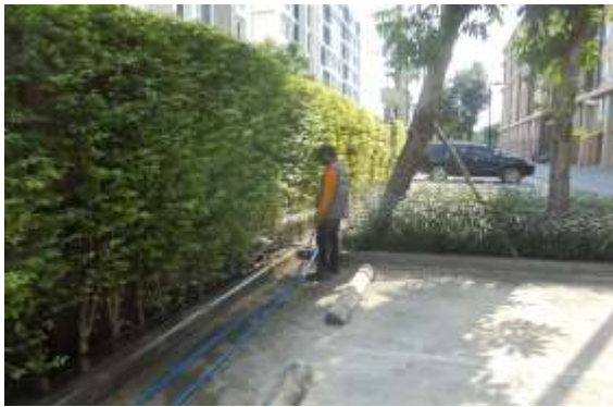
รูปที่ 1 ดูแลต้นไม้และพืชคลุมดิน