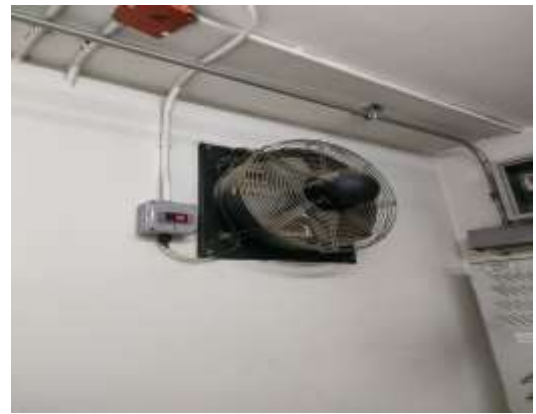
รูปที่ 32 พัดลมระบายอากาศ