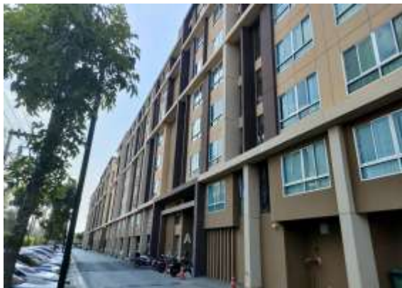
รูปที่ 21 ทาสีอาคารสีอ่อนหรือสีที่ไม่ดูดความร้อน