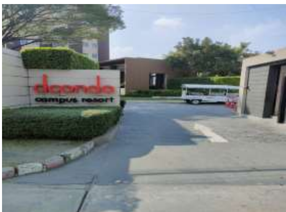
รูปที่ 35 ลูกศรแสดงทิศทาง