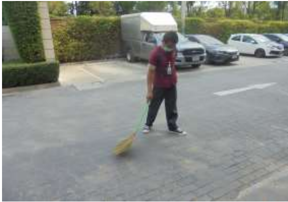
รูปที่ 7 พนักงานรักษาทำความสะอาดพื้นที่ในโครงการ