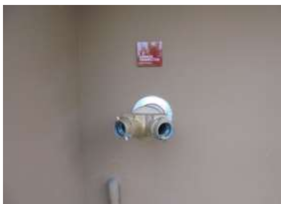
รูปที่ 27 หัวรับน้ำดับเพลิงชนิดข้อต่อสวมเร็ว