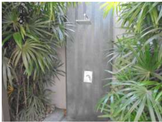
รูปที่ 39 บริเวณทำความสะอาดร่างกาย