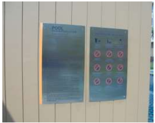
รูปที่ 40 ป้ายแสดงข้อปฏิบัติสำหรับสระว่ายน้ำ