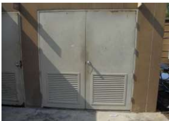
รูปที่ 17 ห้องพัสดุฝอย