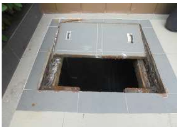
รูปที่ 25 ถังเก็บน้ำสำรองชั้นหลังคา