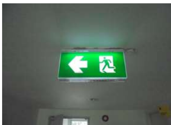
รูปที่ 29 ป้าย “Exit”