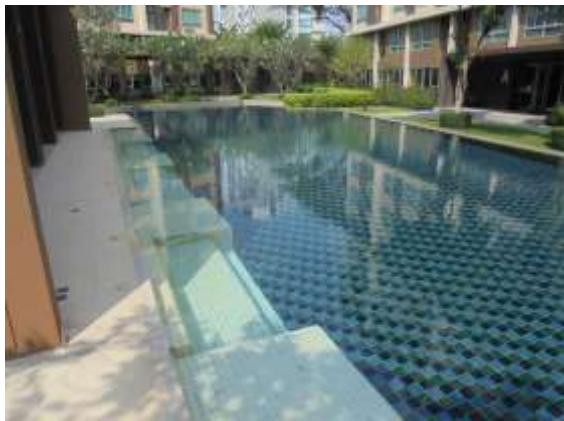
รูปที่ 37 สระว่ายน้ำ