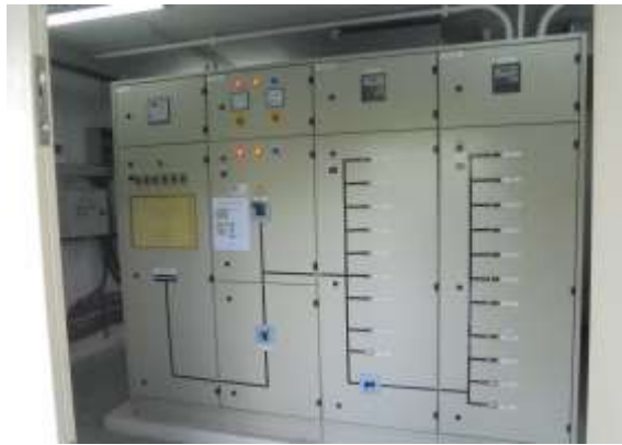
รูปที่ 19 ตู้ควบคุมระบบไฟฟ้าภายในโครงการ