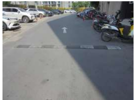
รูปที่ 4 สันนุถนนภายในพื้นที่โครงการ