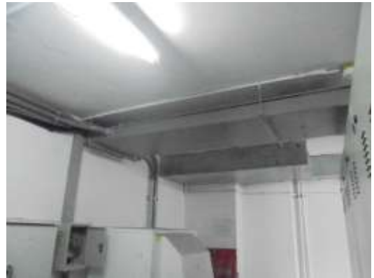
รูปที่ 20 ติดตั้งอุปกรณ์เดินสายไฟฟ้า