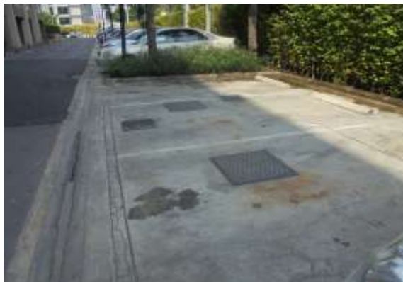
รูปที่ 9 จุดรองรับน้ำเสียในพื้นที่โครงการ