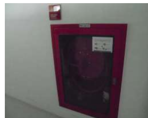
รูปที่ 30 เครื่องดับเพลิงเคมีมือถือ