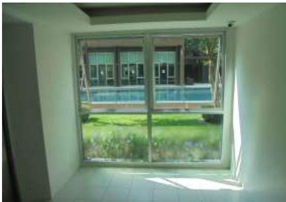
รูปที่ 3 ผนังอาคารที่มีช่องเปิดออกสู่ภายนอกได้