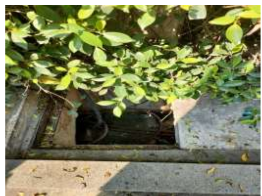
รูปที่ 12 ท่อระบายน้ำทิ้งออกสู่สาธารณะ